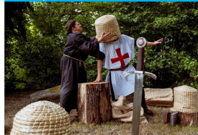
Qui s'y frotte s'y pique