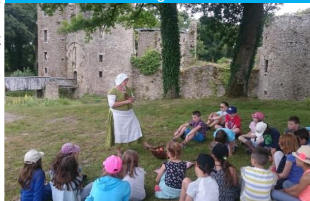
L'alimentation au Moyen Age