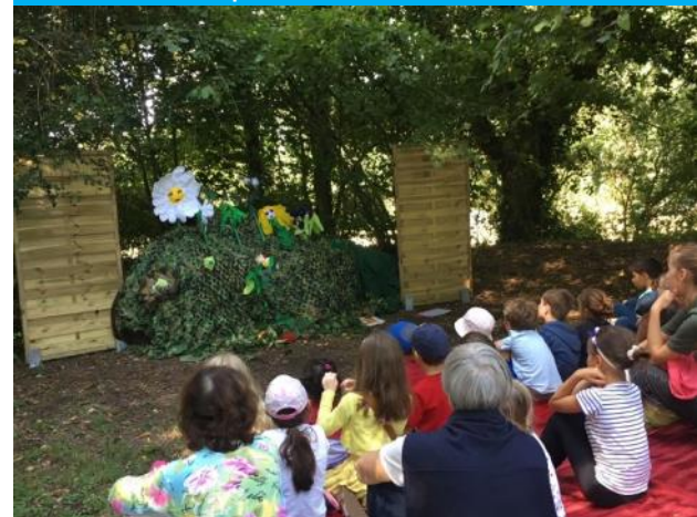
Spectacle Brouette à histoires