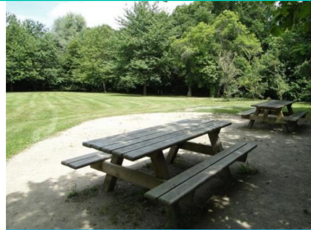
Aire de pique-nique

Afin de s'inscrire au mieux dans une démarche éco-responsable, nous vous encourageons à faire un pique-nique zéro déchet.