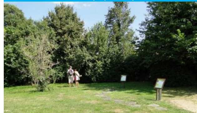
Aire de pique-nique