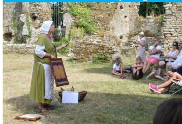
Vie quotidienne au Moyen Âge