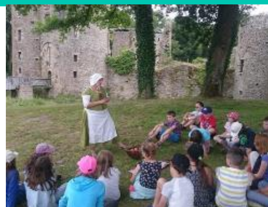
L'alimentation au Moyen-Âge