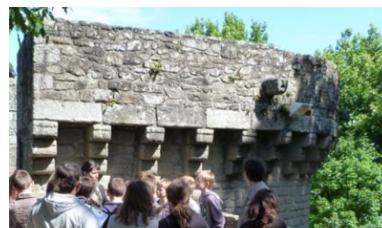
Cité médiévale de Guérande

Ces deux visites complémentaires permettront aux élèves d'appréhender au mieux la période médiévale en découvrant à la fois un exemple de château fort (son rôle, son architecture, son évolution ...) et un exemple de cité médiévale (son architecture, son organisation, ses fonctions...).