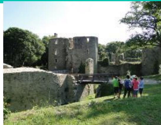
Visite en autonomie