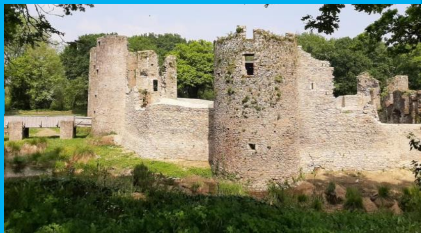
Tours et courtines