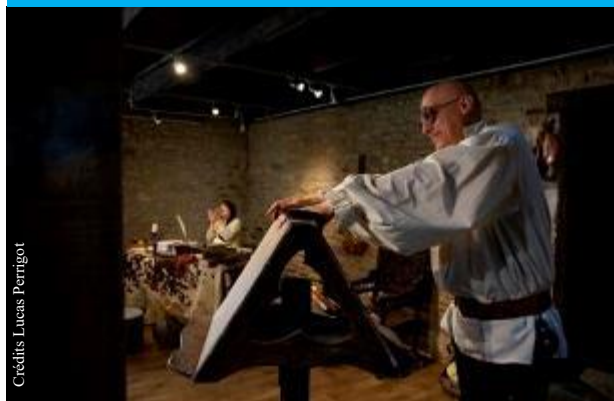
Spectacle La table au Moyen Age