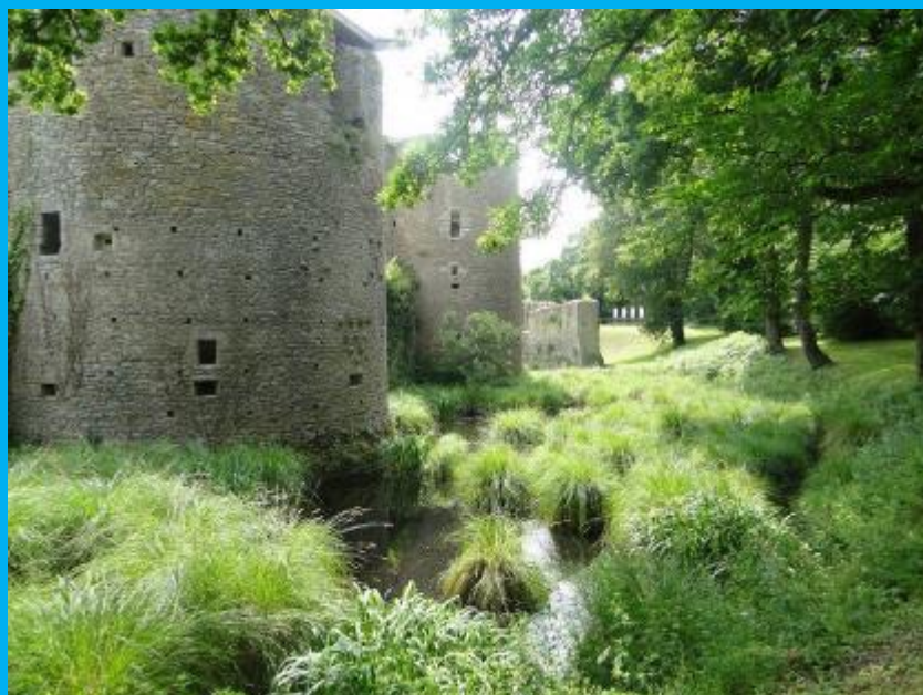
Douves, trous de boulines, canonnières et besants