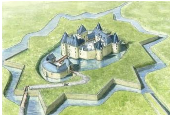
Restitution du château au XVII e siècle

lors des guerres de religions, les bastions, douze pointes triangulaires autour du château, créent nouvelle défense autour du château.