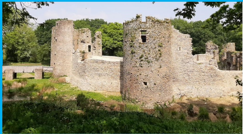
Tours et courtines