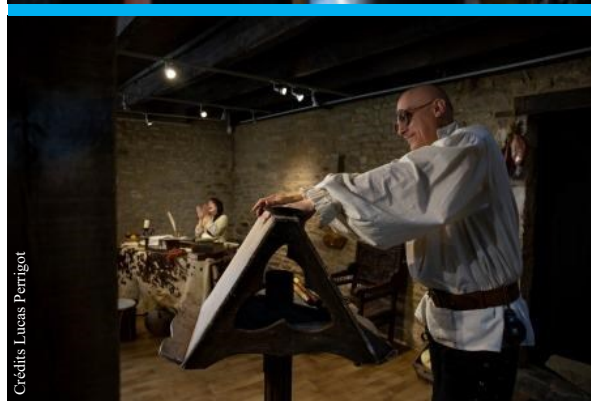
Spectacle La table au Moyen Age