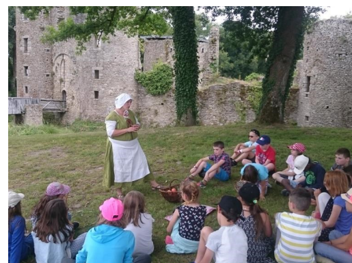
L'alimentation au Moyen-Âge