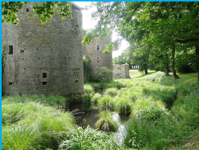
Douves, trous de boulines, canonnières et besants