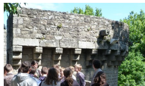
Cité médiévale de Guérande