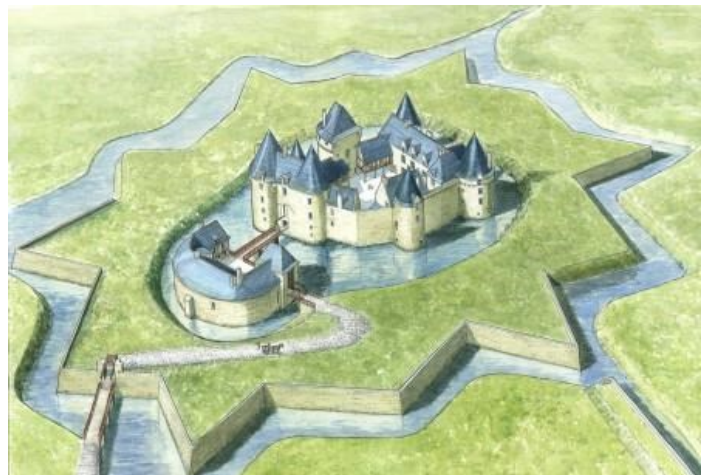
Restitution du château au XVII e siècle

lors des guerres de religions, les bastions, douze pointes triangulaires autour du château, créent nouvelle défense autour du château.