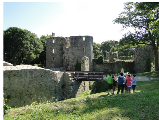
Visite en autonomie