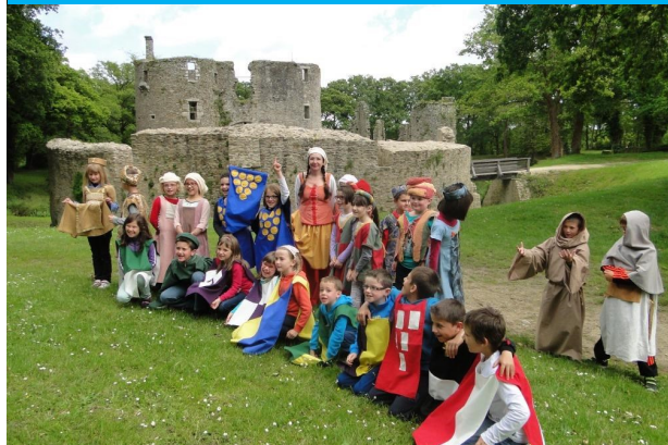
Spectacle Haut les couleurs